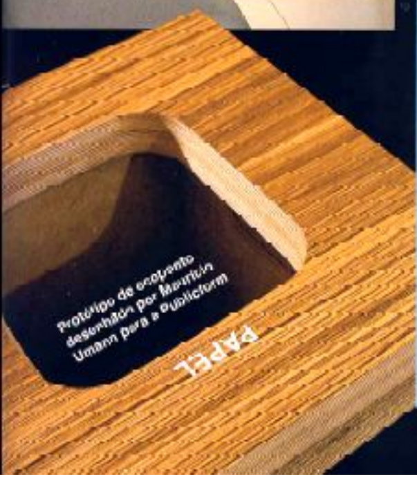
Protótipo de ecoproto desenhado por Maurício Umami para a @publicform