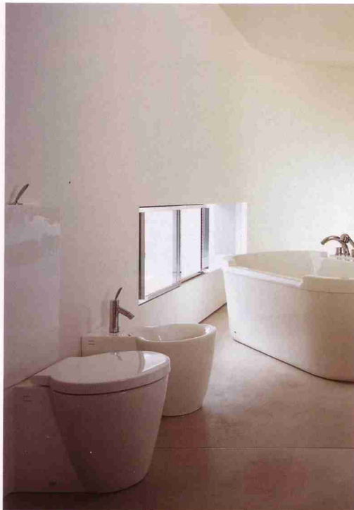
Philippe Starck, serie/series Starck 1, Duravit, 1994

All'apice di questa situazione oggi, convinti che invece valga la pena guardare con scetticismo la firma