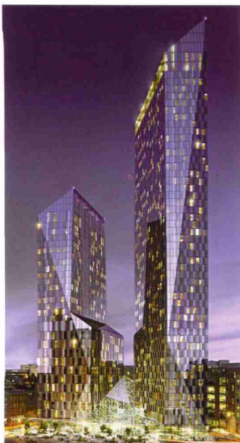
I due edifici residenziali progettati da Ian Simpson a Leeds