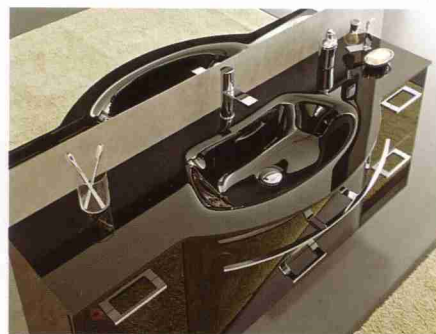
Ares Vetro di Stocco

Ragione e sentimento, modernità e tradizione sono un binomio indissolubilmente legato alla nuova realtà creativa ed espressiva giapponese dove la tradizione si coniuga con la razionalità e con la creatività in una visione moderna della cultura artigianale nipponica. In quest'ottica Mew, che fa parte del gruppo Matsushita, colosso industriale Giapponese, sceglie la vetrina del Salone del Mobile per presentare i 2 sistemi per bagno e cucina disegnati da Naoto Fukasawa. L'apparente neutralità di forme, colori