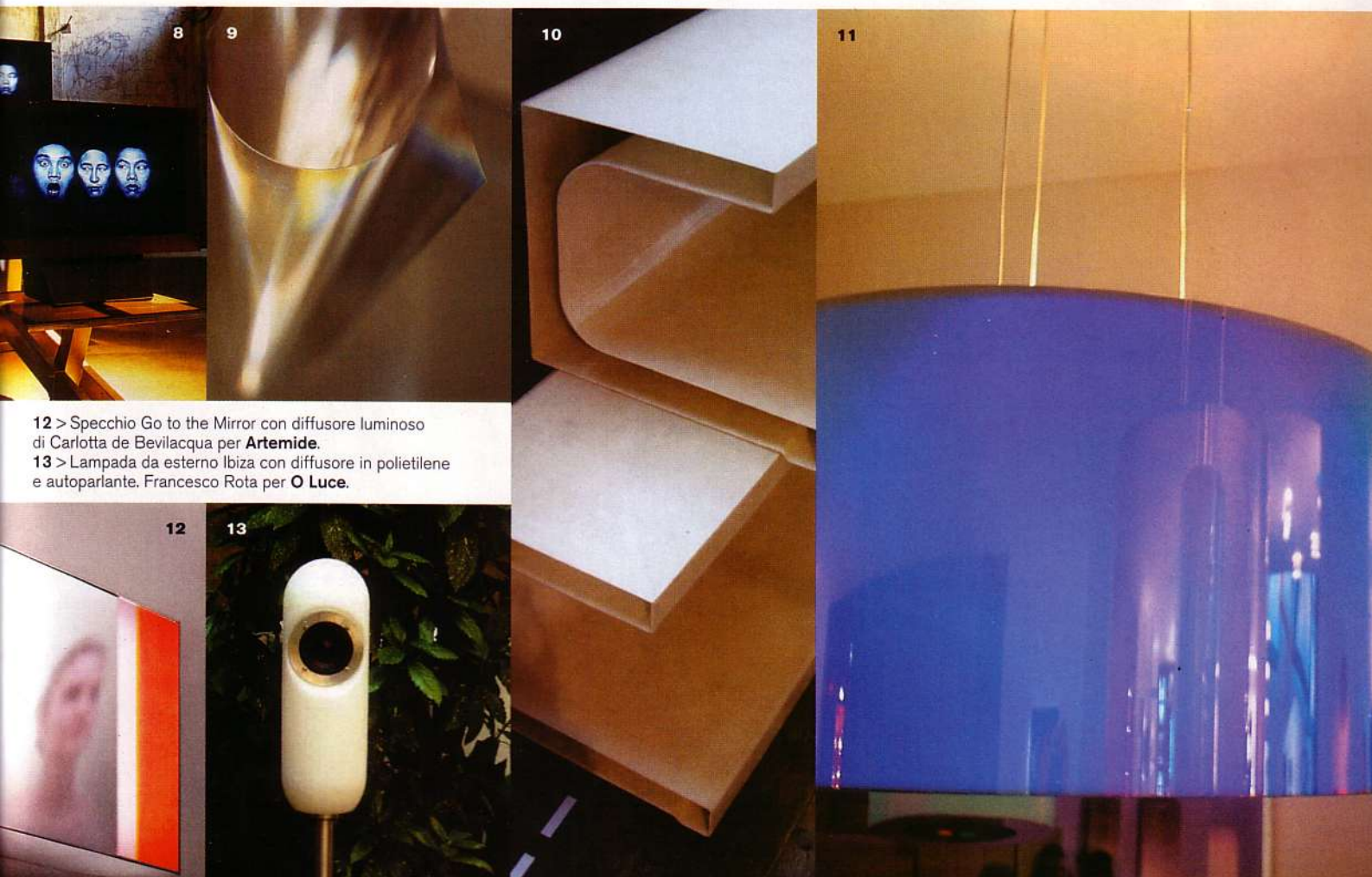
12 > Specchio Go to the Mirror con diffusore luminoso di Carlotta de Bevilacqua per Artemide . 13 > Lampada da esterno Ibiza con diffusore in polietilene e autoperforante. Francesco Rota per O Luce .