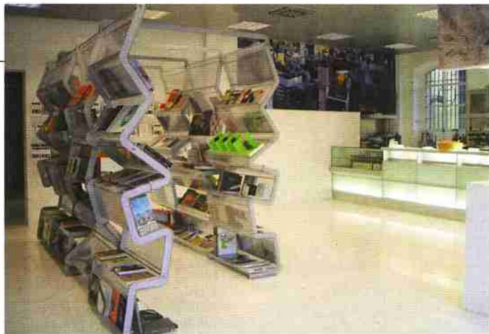
L'interno della raas gallery bookstore caffè. The interior of the Raas gallery bookstore café.

Home in 24 hours. Kit 24 House is the prototype of the technological home designed by Karim Rahid, the New York designer who was born in Cairo, grew up in Canada and passed through Milan. The home, covering an area of 160 square metres, is on two floors and is made completely out of plastic. The architect designed it for the latest Interior Design Show in Toronto in order to promote his exciting and democratic view of design. In addition to the outer shell, the designer also planned all the furniture, accessories and all other details. Italian companies such as Bonaldo, Frighetto, Kundalini and Agape are also involved in the project.