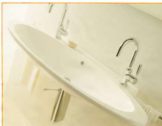
Voor stellen die beiden gelijktijdig een plaatsje aan de wasbak willen: de tweepersoons wastafel van Wet®.