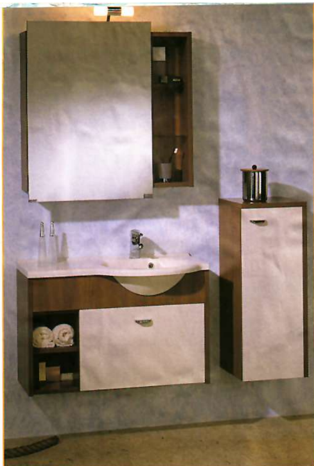
Wastafelmeubel van BanuBad. Het wasbakje en bovenblad vormen één geheel van kunststof. De leidingen zijn onzichtbaar weggewerkt achter het kastje.