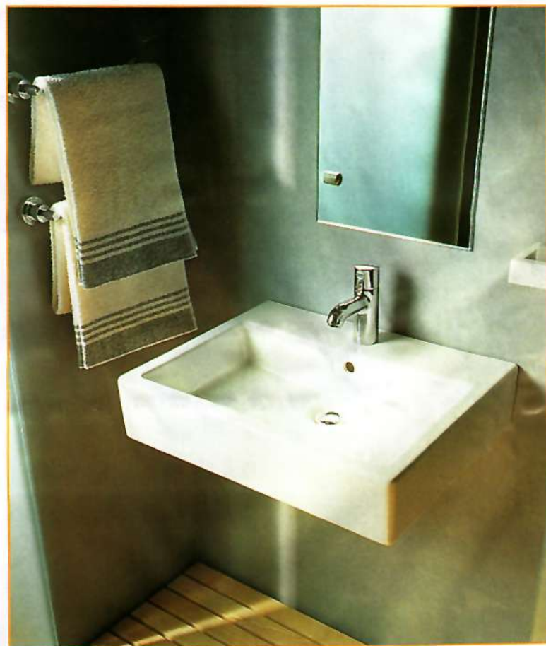
De solide rechthoekige wasbak van Duravit lijkt uit de muur te steken. Lelijke leidingen zijn onzichtbaar weggewerkt.