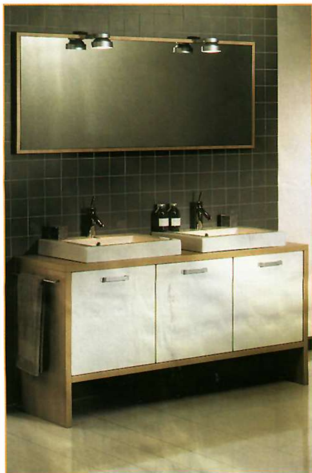
Vereniging van klassieke materialen in een modern jasje: twee porseleinen wasbakken (Detremmerie) zijn verwerkt in een strak badkamermeubel.

Lelijke leidingen kunt u eenvoudig wegwerken met een zuil onder de wastafel. De ruimte onder de wastafel en achter de zuil is dan wel moeilijk schoon te maken. Een oplossing is een halve, hangende zuil. Zijn de leidingen toch netjes weggewerkt en blijft het vloeroppervlak goed bereikbaar voor dweil of mop.