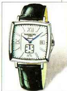
MARCA: Raymond Weil MODELLO: Time Square, con movimento meccanico a carica automatica di Eta PREZZO: 1.350 euro

medio alta che negli ultimi tempi ha fatto segnare le maggiori sofferenze. La risposta giusta è proprio quella di marche come Raymond Weil: sfruttare la propria storia e il proprio bagaglio tecnico per ottimizzare il lavoro. Il risultato è un orologio di moderne dimensioni, ricco di dettagli qualificanti come gli indici applicati, la cornice intorno al quadrante dei secondi continui, le sporgenze di protezione per la corona e la finitura, eccellente. Basti pensare che gli angoli sono arrotondati con un lavoro di finitura manuale che di solito è presente in orologi di prezzo superiore. Anche il movimento meccanico a carica automatica di Eta, è una sicurezza.