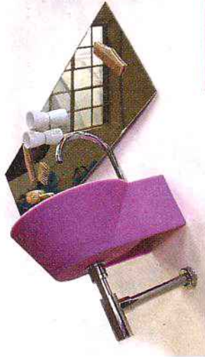
Los lavamanos de la firma Wet se iluminan y cambian de color.