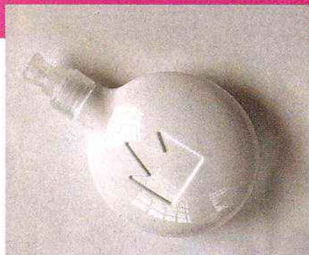
Con un sistema de imán, los dispensadores de jabón también se pegan a la pared.