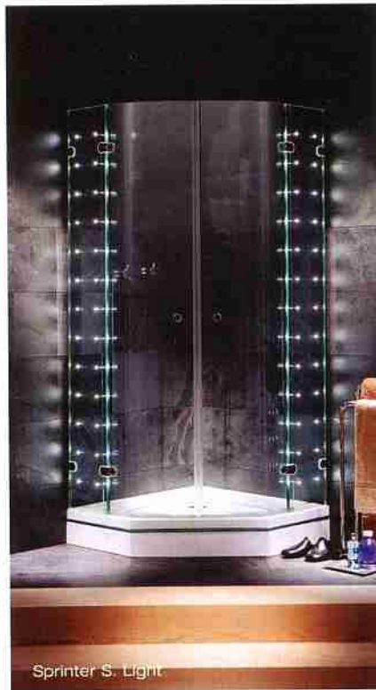
Sprinter S. Light